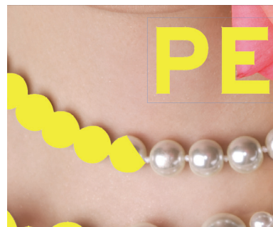
Legen Sie einen Pfad an und füllen Sie ihn mit der Schmuckfarbe Varnish