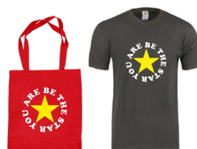
Endergebnis bei korrekter Datenaufbereitung