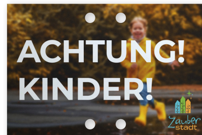
Fertiges gelochtes Endergebnis