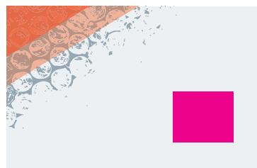
Beispiel: Visitenkarte 85 x 55mm – immer wenn die kurze Kante kleiner als 200mm ist, muss das Mindestmaß verwendet werden