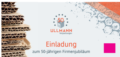
Beispiel: 210 x 99mm Flyer – da das Logo bei 10% der kürzeren Kante zu klein wäre, muss es laut Mindestmaß 20mm breit sein

Wir freuen uns auf Ihre Bestellung! Damit setzen Sie ein Zeichen für Nachhaltigkeit und heimische Druckprodukte!