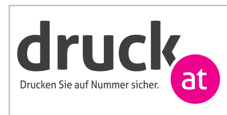
Gestaltungsebene mit Veredelung