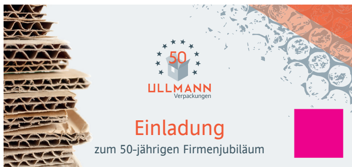
Beispiel auf 210 x 99mm Flyern

Wir freuen uns auf Ihre Bestellung! Damit setzen Sie ein Zeichen für Nachhaltigkeit und heimische Druckprodukte!